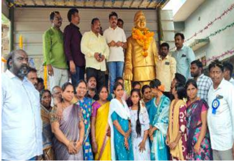
ముద్ర వేసిన గొప్ప నాయకుడని తెలిపారు. జగజ్జీవన్ రామ్ వ్యవసాయం, రక్షణ, కార్మిక రంగాల్లో కీలక బాధ్యతలు నిర్వహించి దేశ అభివృద్ధికి విశేషంగా సేవలందించారు. ఆయన దూరదర్శి వల్లే అనేక సంక్షేమ కార్యక్రమాలు అమలులోకి వచ్చాయని చెప్పారు. ప్రస్తుతం రాష్ట్ర ప్రభుత్వం కూడా అదే దిశగా పేదల సంక్షేమం,