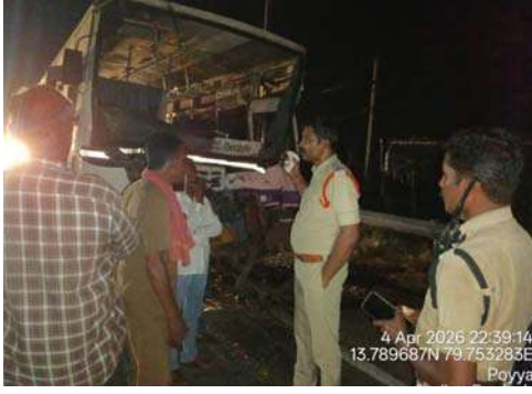
గంటల సమయంలో జామ్ జామ్ హోటల్ సమీపంలో ఈ ప్రమాదం చోటుచేసుకుంది. బస్సు (AP 26Z0382) అదుపుతప్పి, రోడ్డువక్రస్థ నిలిపి ఉంచిన లారి (AP39UL2712)ను డిఫాల్ట్ చేసింది.

శ్రీకాళహస్తి--నాయుడుపేట జాతీయ రహదారిపై శనివారం రాత్రి జరిగిన రోడ్డు ప్రమాదం స్థానికంగా ఆందోళన కలిగించింది. తిరుపతి నుంచి నెల్లూరు వైపు వెళ్తున్న ఆర్టీసీ బస్సు, రోడ్డుకు ప్రక్కన ఆగి ఉన్న ఖాళీ లారిని డిఫాల్టుతో డ్రైవర్తో పాటు ఐదుగురు ప్రయాణికులు గాయపడ్డారు. ఏప్రిల్ 4వ తేదీ రాత్రి సుమారు 9.10