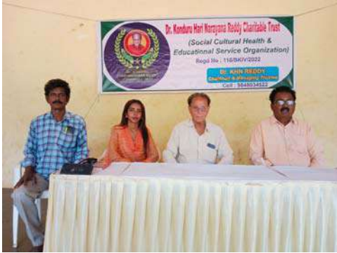
1911 జూన్ ఒకటో తేదీన మద్రాస్ ప్రెసిడెంట్ లో ఉన్న చంగల్లుట